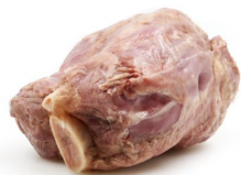
JAMBONNEAU CUIT BLANC DÉGRAISSÉ GEKOOKT EN ONTVET ACHTERHAMMETJE