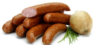
SAUCISSE CHOUCROUTE 7PC ZUURKOOL WORST 7ST