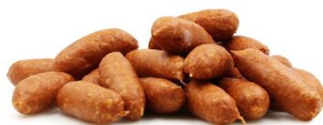
MINI SAUCISSE CHOUCROUTE 50PC MINI ZUURKOOL WORST 50ST