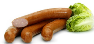
SAUCISSE KRAKOWSKA 4PC KRAKOWSKA WORST 4ST