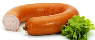
SAUCISSON LUNCH LUNCHWORST