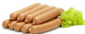
SAUCISSE FRANCFORT 20PC FRANKFURTER 20ST