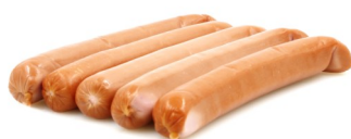
SAUCISSE FRANCFORT 5PC FRANKFURTER 5ST