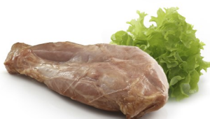
JAMBONNETTE CUIE FUMÉE DÉGRAISSÉE GEKOOKT EN GEROOKT ONTVET HAMMETJE

DISPO 1-52 POIDS 0,250KG BESCHIK. GEWICHT DLC/THT 30 J/D