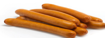
SAUCISSE FRANCFORT BOYAU NATUREL FRANKFURTER NATUURLIJKE DARM 20ST