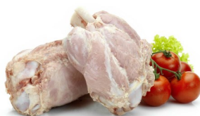
JAMBONNEAU CUIT BLANC DÉGRAISSÉ 4PC GEKOOKT EN ONTVETTE HAMMETJE 4ST

DISPO 1-52 POIDS 0,600KG BESCHIK. GEWICHT DLC/THT 30 J/D