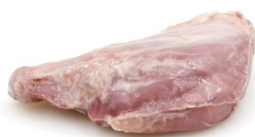
JAMBONNETTE CUIE BLANCHE DÉGRAISSÉE GEKOOKT EN ONTVET HAMMETJE

DISPO 1-52 POIDS 0,600KG BESCHIK. GEWICHT DLC/THT 30 J/D