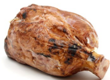
JAMBONNEAU CUIT BRAISÉ DÉGRAISSÉ GEGRILD EN ONTVET ACHTERHAMMETJE

DISPO 1-52 POIDS 0,600KG BESCHIK. GEWICHT DLC/THT 30 J/D