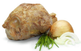
JAMBONNEAU CUIT FUMÉ AVEC COUENNE GEKOOKT EN GEROOKT ACHTERHAMMETJE MET ZWOERD

DISPO 1-52 POIDS 0,600KG BESCHIK. GEWICHT DLC/THT 30 J/D