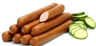
SAUCISSE VIENNOISE 10PC WEENSE WORST 10ST