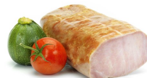
ROTI DE PORC CUIT ½ GEKOOKT VARKENSGBRAAD ½