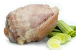
JAMBONNEAU CUIT BLANC AVEC COUENNE GEKOOKT ACHTERHAMMETJE MET ZWOERD

DISPO 1-52 POIDS 2,40KG BESCHIK. GEWICHT DLC/THT 14 J/D