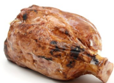
JAMBONNEAU CUIT BRAISÉ DÉGRAISSÉ GEGRILD EN ONTVET ACHTERHAMMETJE

DISPO 1-52 POIDS 0,600KG BESCHIK. GEWICHT DLC/THT 30 J/D